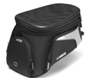
Brašna na nádrž pro model City

For all XT1200Z Super Ténéré accessories go to the website, or check your local dealer